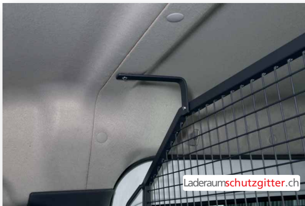
Laderraumschutzgitter Nr: 110 - Laderraumschutzgitter hinter den vorderen Sitzen

Drei Handwerker diskutieren über das Alter ihres Berufes. Jeder glaubt den älteren zu haben. Sagt der Maurer: Ich habe den ältesten Beruf, wir Maurer haben schon die Pyramiden in Ägypten gebaut! Antwortet der Gärtner: Das ist noch gar nichts. Mein Beruf ist noch älter, wir Gärtner haben schon den "Gaden Eden" gepflanzt! Sagt der Elektriker: Ach was! Die Elektriker sind die ältesten: Als Gott sprach, das es Licht werde, haben wir schon vorher die Leitungen verlegt.