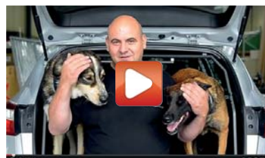
Video Roman Gilgen GmbH