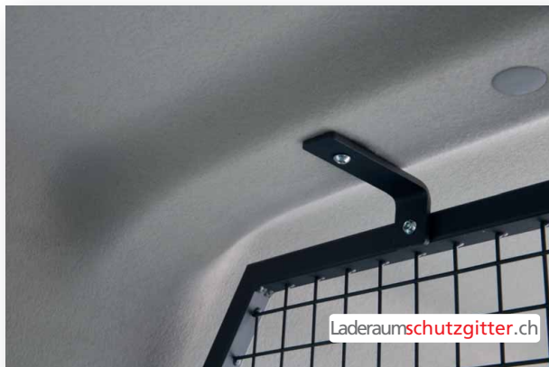
Laderraumschutzgitter Nr: 110 - Laderraumschutzgitter hinter der 2. Sitzreihe

"Ist das richtig?" fragt der Klempner, "in dieser Wohnung soll ein Rohrbruch sein?" "Bei uns ist alles in Ordnung!" antwortet die Hausfrau. "Merkwürdig! Wohnen denn hier nicht Kunzes?" "Kunzes? Die sind doch schon vor einem halben Jahr umgezogen!" "War ja wieder einmal klar! Erst bestellen sie die Handwerker, und dann ziehen sie Hals über Kopf aus!"